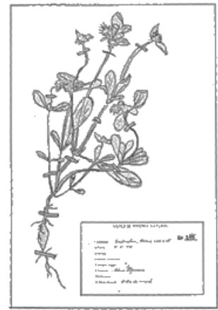
Figura 5. La planta desecada está fijada a la cartulina con delgadas tiras de papel engomado.

un taxónomo, por lo general un biólogo especialista en el estudio y clasificación de las plantas es el que clasifica la planta especificando la Familia, género y especie. El nombre científico identifica a la planta y con este es conocida en todo el mundo.