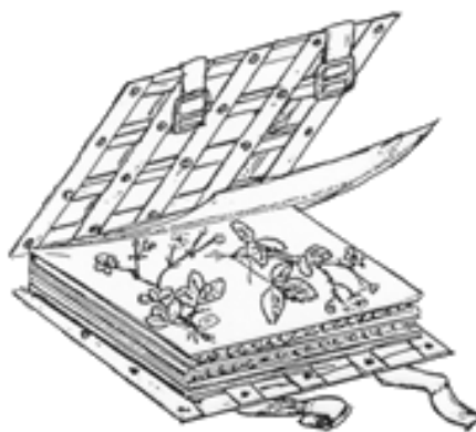
Figura 3. Prensa portátil