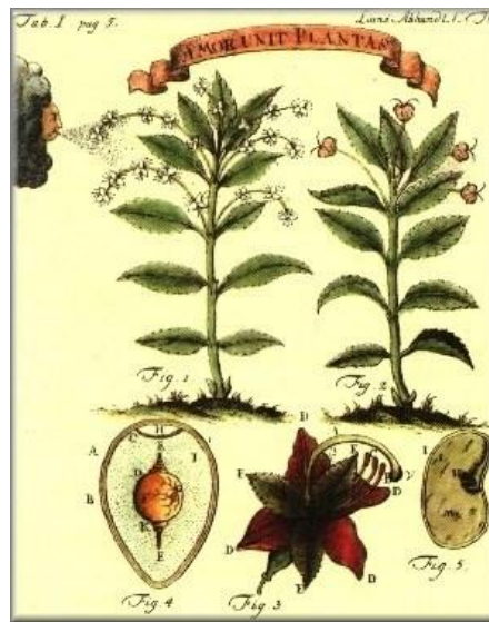
Herbario de Linneo en el año de 1732

La palabra herbario originalmente se refería a un libro de plantas medicinales, pero en la actualidad denota una entidad que maneja una colección de ejemplares vegetales en una secuencia de clasificación aceptada,